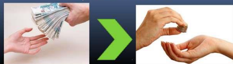
Вариант № 1

Превышение доходов над расходами образует положительный остаток бюджета ПРОФИЦИТ