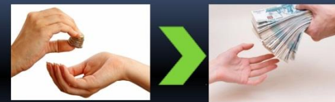
Вариант № 2