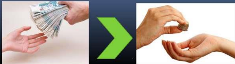
Вариант № 1

Если расходная часть бюджета превышает доходную, то бюджет формируется с ДЕФИЦИТОМ